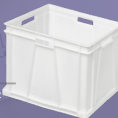
Caja NE 6442