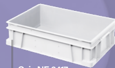
Caja NE 6417