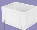
Caja NE 4323