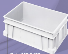
Caja NE 6423