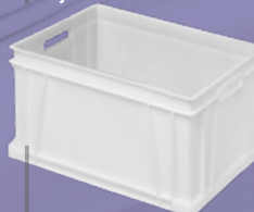
Caja NE 6432