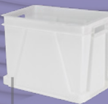
Caja NE 4332